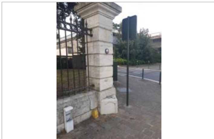
Repères sur l'enceinte du bâtiment accueillant l'Établissement Public Loire (2021)