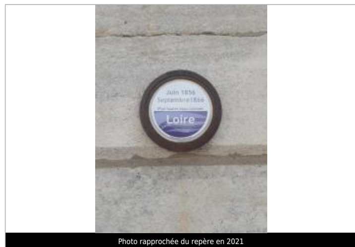
Photo rapprochée du repère en 2021