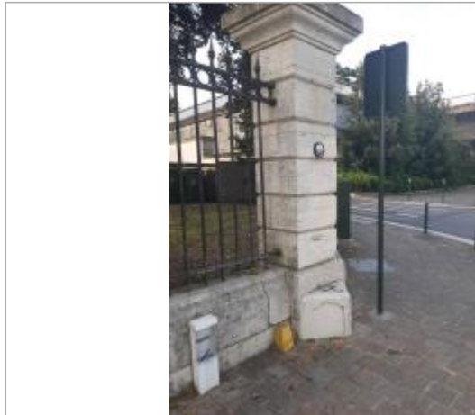
Repères sur l'enceinte du bâtiment accueillant l'Établissement Public Loire (2021)