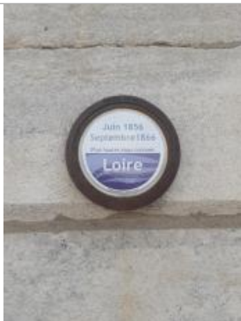
Photo rapprochée du repère en 2021