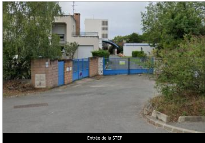
Entrée de la STEP