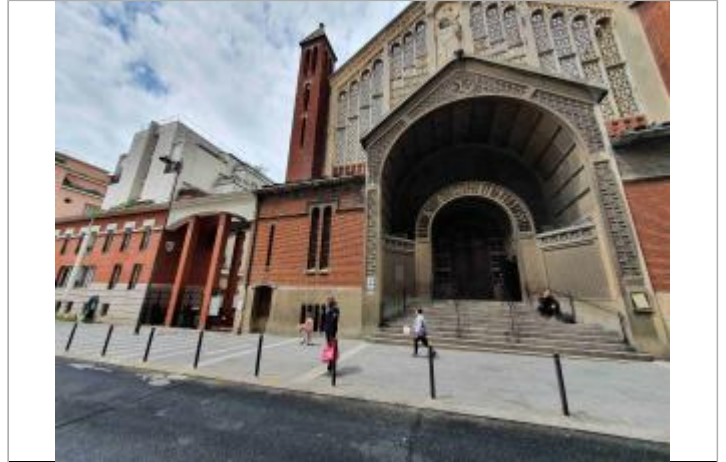
Escalier d'accès à l'Eglise