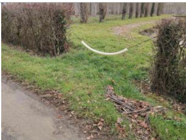
Vue du repère - Photo © AGERIN