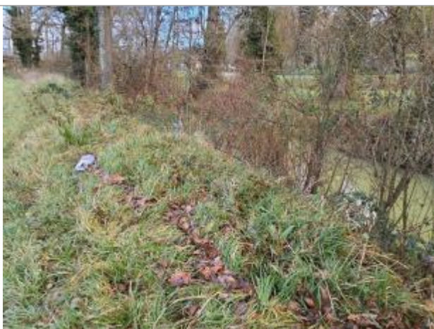
Vue du repère - Photo © AGERIN

Altitude calculée de l'eau (en m) : 155.39