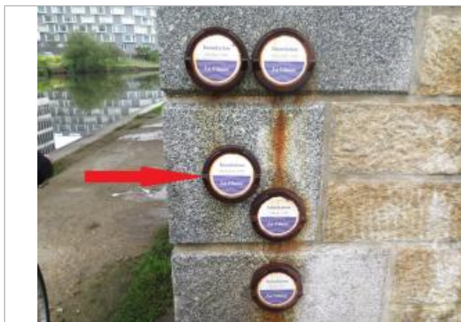
Repère normalisé de l'inondation du 29 décembre 1999