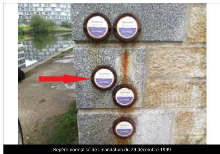
Repère normalisé de l'inondation du 29 décembre 1999

GÉNÉRAL Code : RC VIL REN 28-5 Date de mise à jour : 08/10/2021 Auteur : SPC VCB