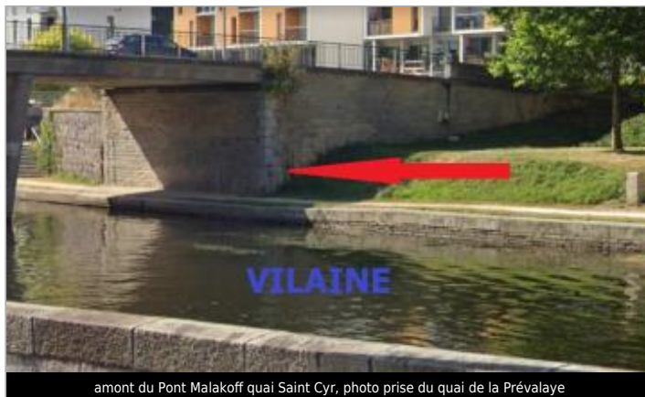
amont du Pont Malakoff quai Saint Cyr, photo prise du quai de la Prévalaye