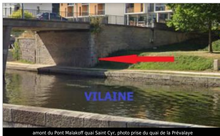
amont du Pont Malakoff quai Saint Cyr, photo prise du quai de la Prévalaye

GÉOLOCALISATION Coordonnées WGS84 : X: -1.69300250 / Y: 48.10763900 Coordonnées RGF93 (Lambert 93) X: 350914.31 / Y: 6788961.9 Coordonnées RGF93 (ETRS89) : X: -1.6930025 / Y: 48.107639 Code Hydro: J---0060 Rive de référence: Droite