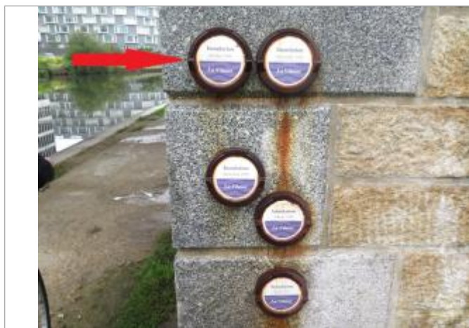
Repère normalisé de l'inondation du 26 octobre 1966