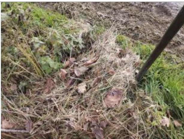
Vue du repère - Photo © AGERIN