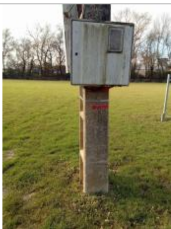
Vue du repère - Photo © AGERIN