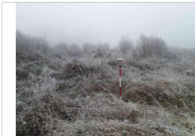
Vue du repère - Photo © AGERIN