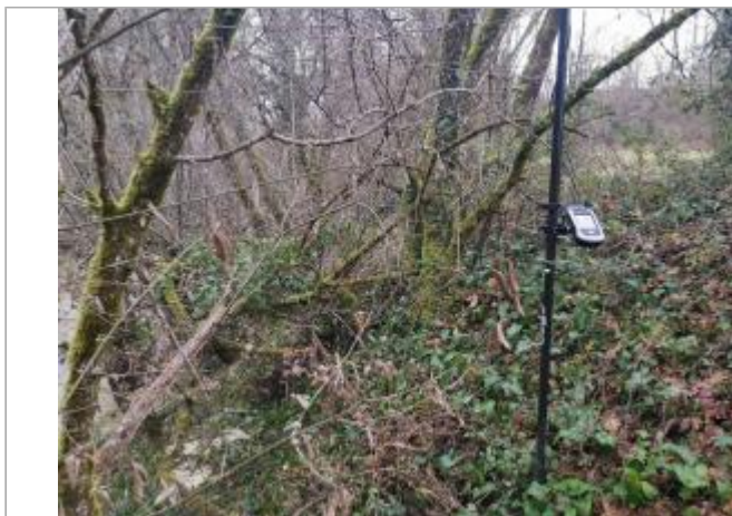
Vue du site - Photo © AGERIN

Coordonnées WGS84 : X: 0.27445242 / Y: 44.11242740