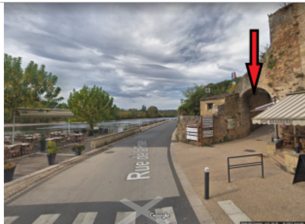
Sous l'arche

Coordonnées WGS84 : X: 0.88870600 / Y: 44.88282200