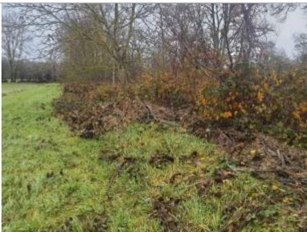
Vue du repère - Photo ©AGERIN

Altitude calculée de l'eau (en m) : 101.64 m