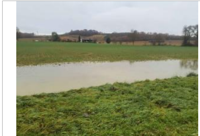
Vue du site - Photo ©AGERIN

Coordonnées WGS84 : X: 0.61575801 / Y: 43.78690060