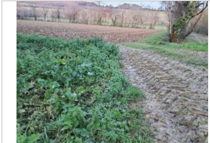
Vue du site - Photo ©AGERIN

Coordonnées WGS84 : X: 0.64985861 / Y: 43.89895890