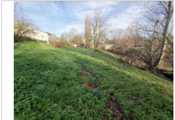
Vue du site - Photo ©AGERIN

Coordonnées WGS84 : X: 0.38018563 / Y: 43.72292420