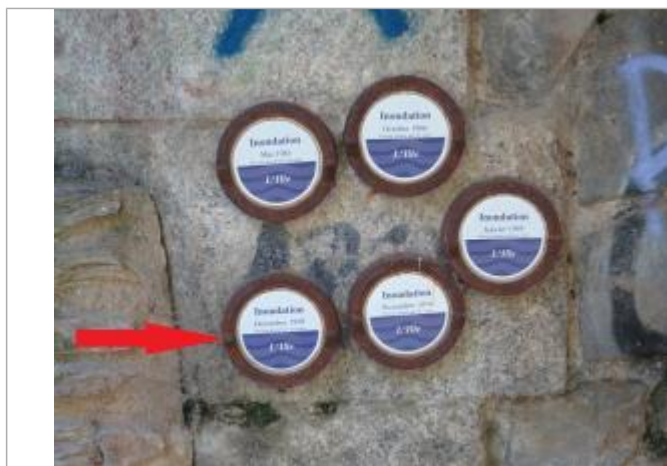
Repère normalisé de l'inondation du 29 décembre 1999

Altitude calculée de l'eau (en m) : 24.89 m