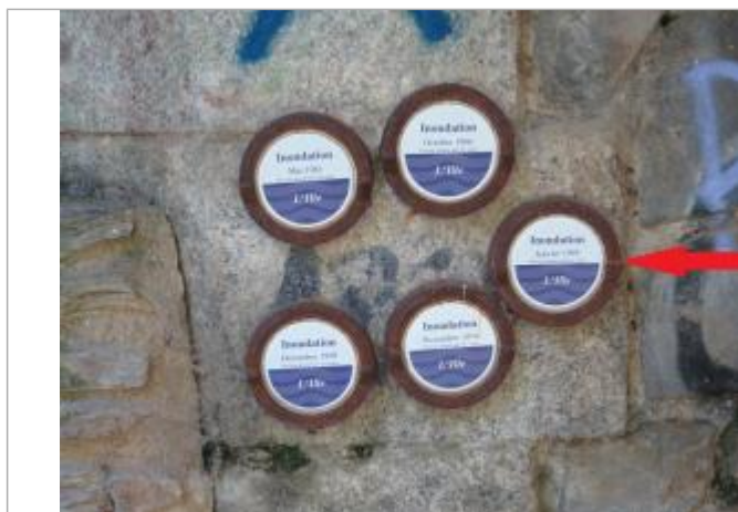
Repère normalisé de l'inondation du 20 janvier 1995

Altitude calculée de l'eau (en m) : 25 m