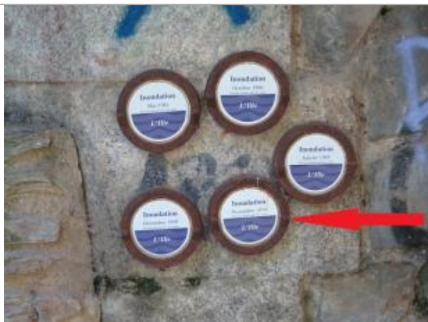
Repère normalisé de l'inondation du 16 Novembre 1974

Altitude calculée de l'eau (en m) : 24.9 m