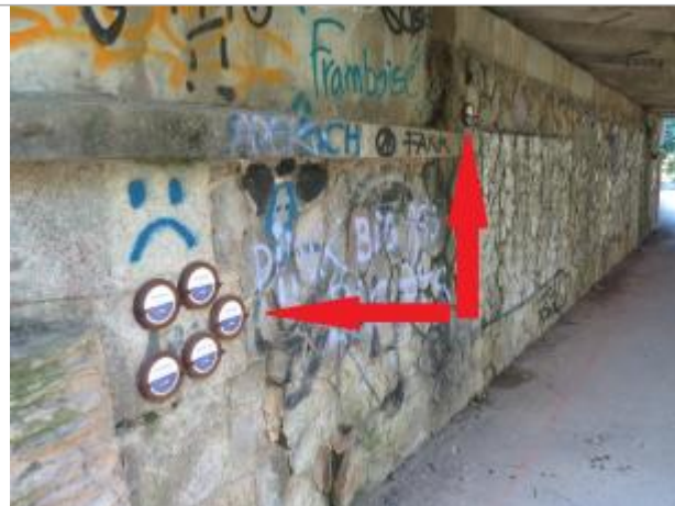
Sous le pont de la rue Papu