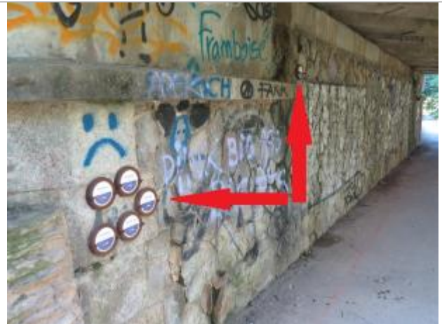
Sous le pont de la rue Papu