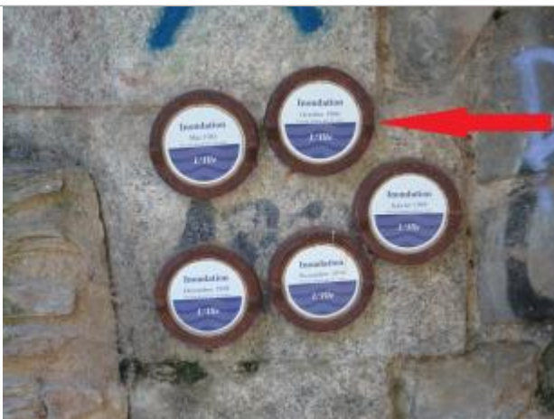
Repère normalisé de l'inondation du 24 octobre 1966

Altitude calculée de l'eau (en m) : 25.12 m