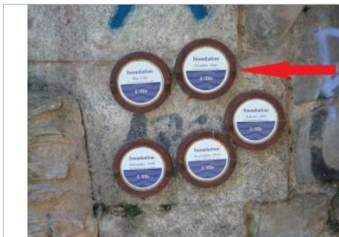
Repère normalisé de l'inondation du 24 octobre 1966

Altitude calculée de l'eau (en m) : 25.12 m