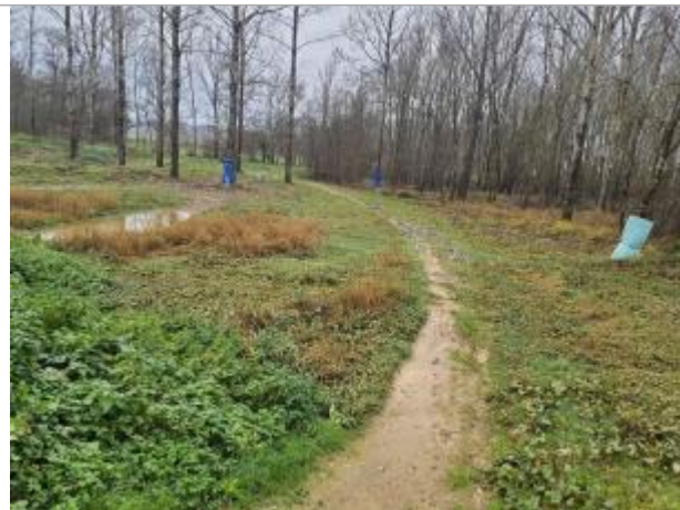
Vue du site - Photo ©AGERIN

Coordonnées WGS84 : X: 0.61978087 / Y: 43.92285670