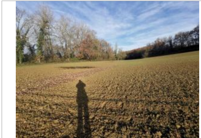
Vue du site - Photo ©AGERIN

Coordonnées WGS84 : X: 0.38524258 / Y: 43.71411920