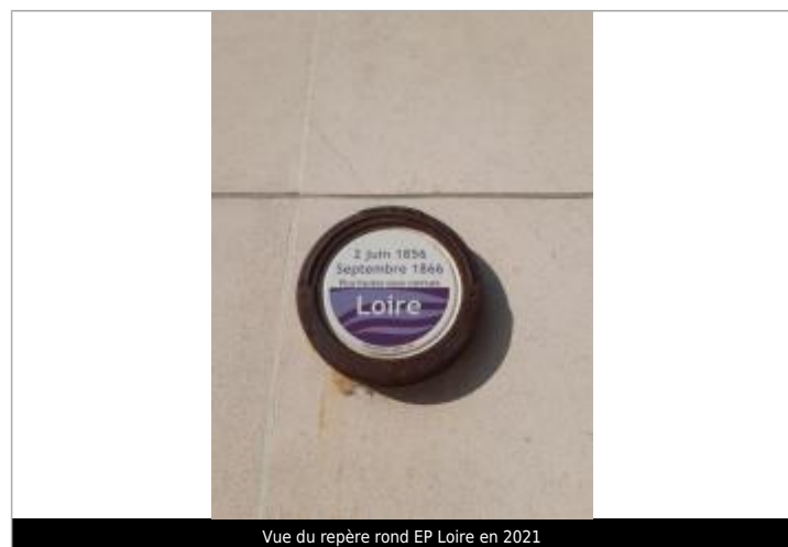
Vue du repère rond EP Loire en 2021