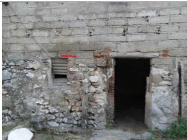
trait rouge au dessus de la fenêtre