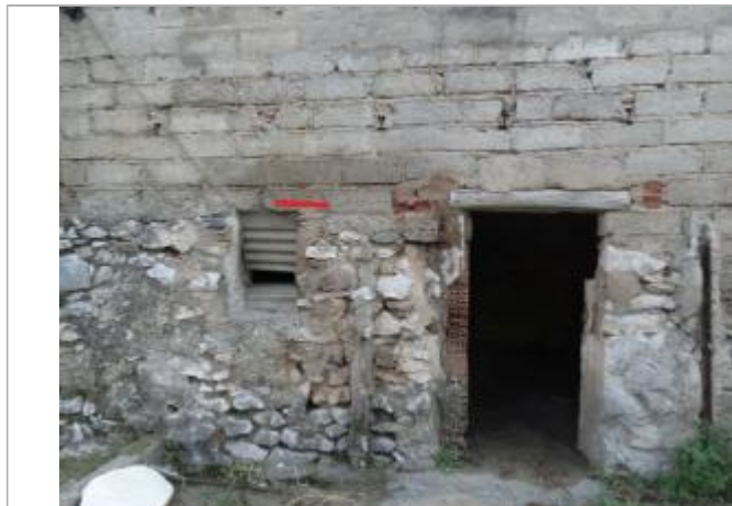
trait rouge au dessus de la fenêtre