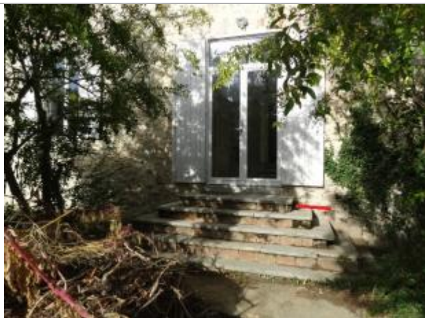
laisse au niveau du trait rouge