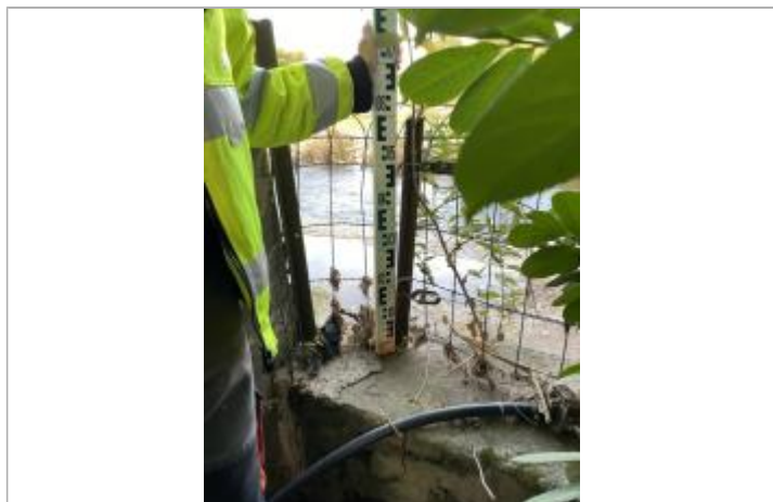
muret de référence et laisse dans grillage