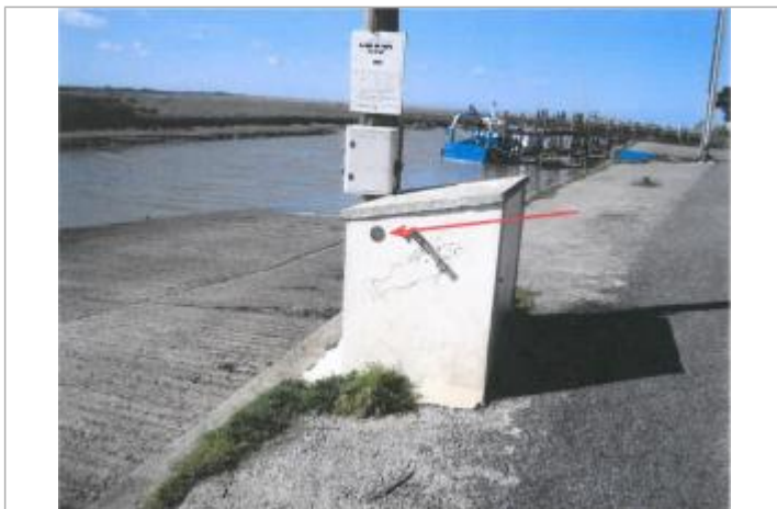
Cale Port du Collet