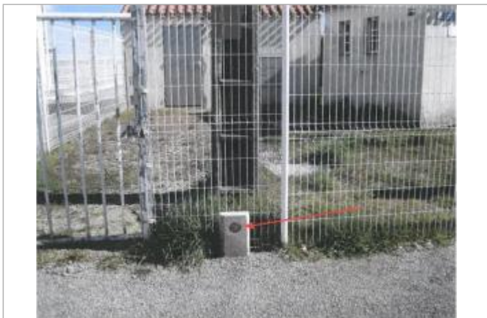
repère sur domaine public