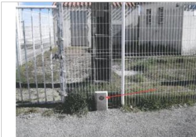
repère sur domaine public