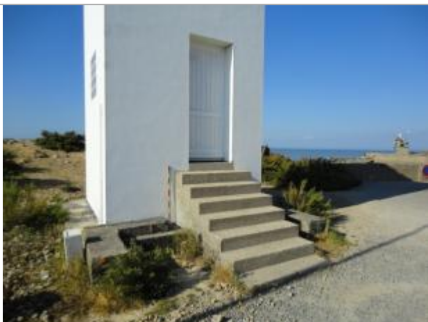
Muret béton du phare