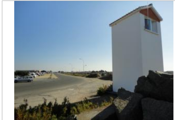
Phare du Port du Bec