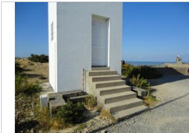
Muret béton du phare