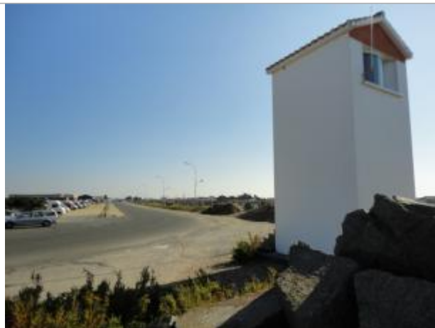
Phare du Port du Bec