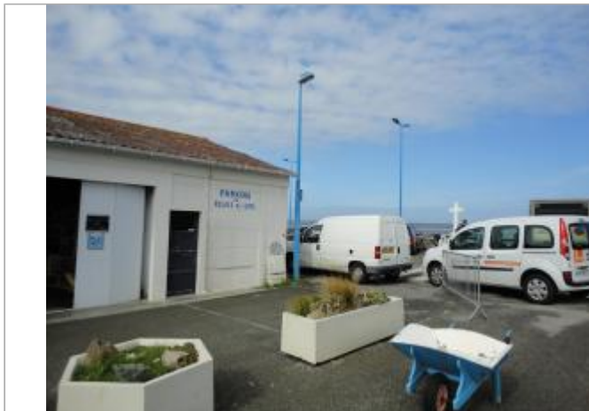
Réserve du restaurant

Coordonnées RGF93 (ETRS89) : X: -2.1037313 / Y: 46.9210905