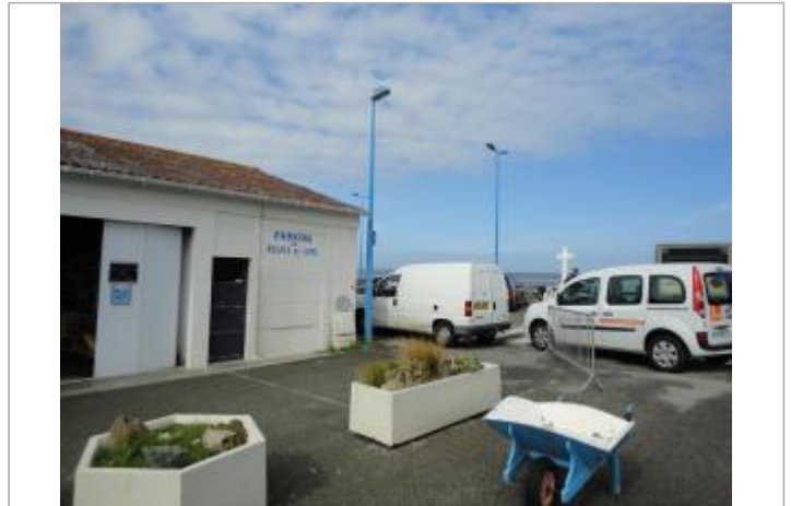
Réserve du restaurant