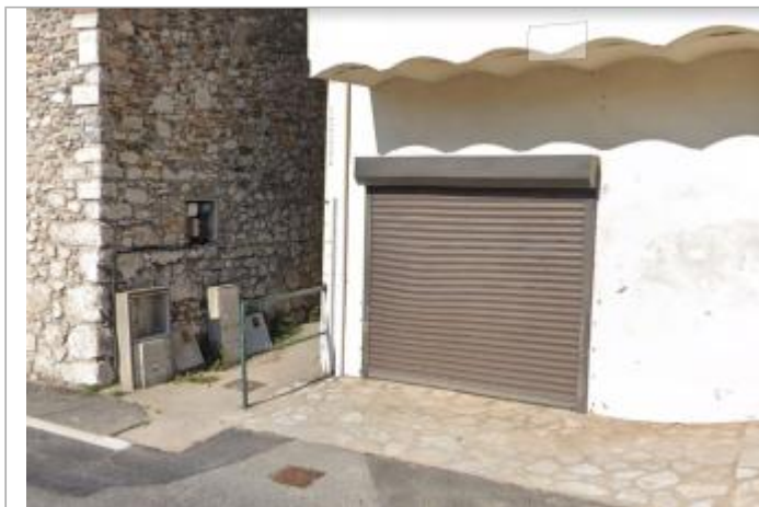
échelle coin bâtiment

Coordonnées WGS84 : X: 3.72523670 / Y: 43.92168800