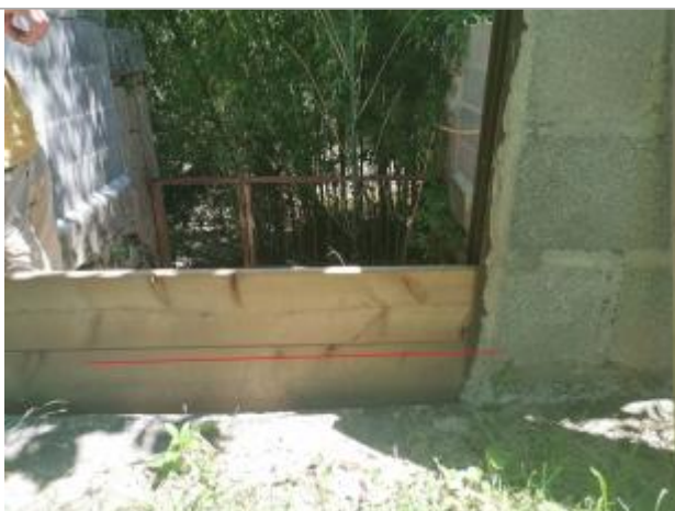
Planche bois cloison

Altitude calculée de l'eau (en m) : 152.51 m