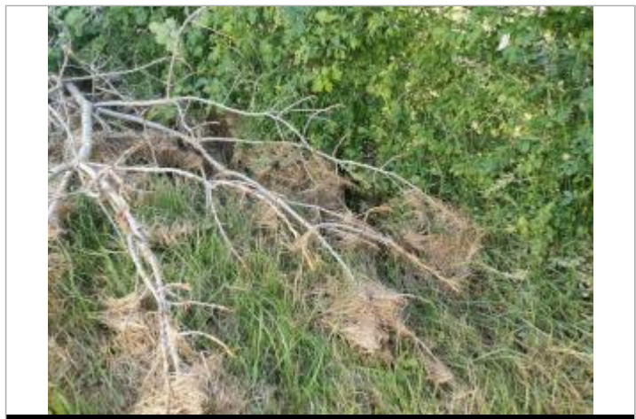
Débris sur arbre coupé

GÉNÉRAL Code : SOR2020_R_41_1 Date de mise à jour : 04/06/2021 Auteur : SPC GTL