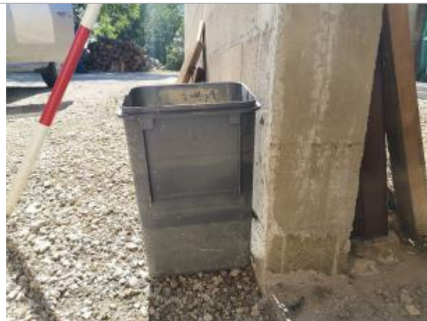
Mur bâtiment

Coordonnées WGS84 : X: 1.96034900 / Y: 43.49898600