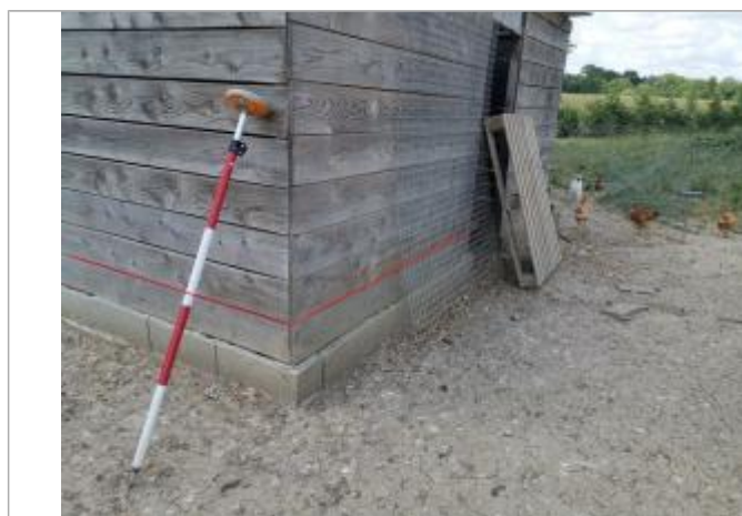
Batiment bois

Code : SOR2020_R_26_1 Date de mise à jour : 04/06/2021 Auteur : SPC GTL