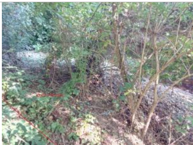
Débris sur grillage