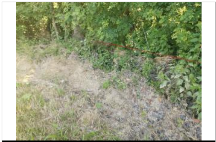
Débris sur la végétation

GÉNÉRAL Code : SOR2020_R_16_1 Date de mise à jour : 04/06/2021 Auteur : SPC GTL