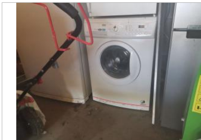
Marque sur électroménager