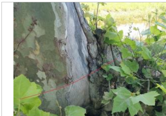
Trace de boue sur arbre

Altitude calculée de l'eau (en m) : 183.18