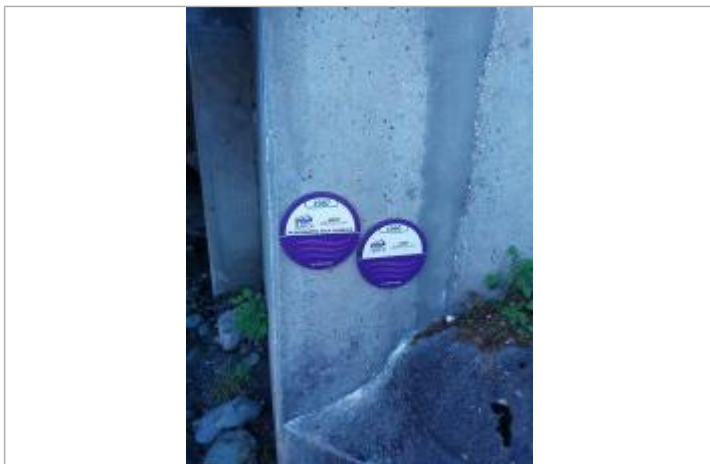
Repère de crue, Le Bronze, février 1990, Mont-Saxonnex