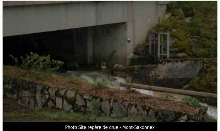
Photo Site repère de crue - Mont-Saxonnex