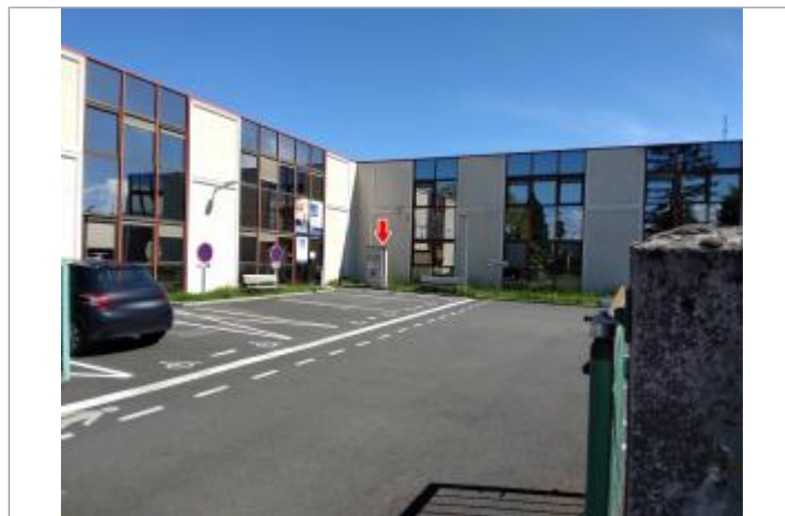
Vue du site, en 2021

GÉOLOCALISATION Coordonnées WGS84 : X: 1.89811860 / Y: 47.88538900 Coordonnées RGF93 (Lambert 93) X: 617647.1 / Y: 6754462.93 Coordonnées RGF93 (ETRS89) : X: 1.8981186 / Y: 47.885389 Code Hydro: ----0000 Rive de référence: Gauche