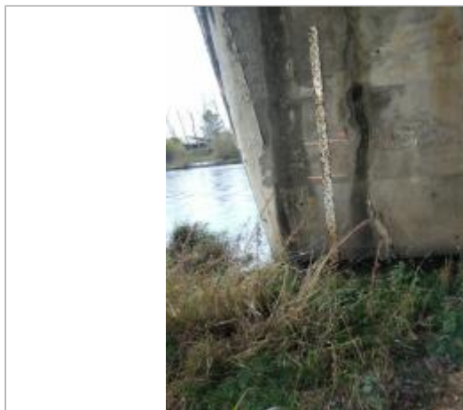
Pile de pont