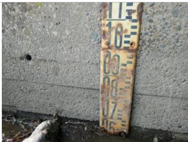
Laisse de crue sur échelle limnimétrique