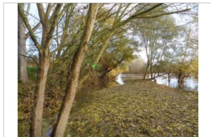
Laisse de végétaux sur arbre