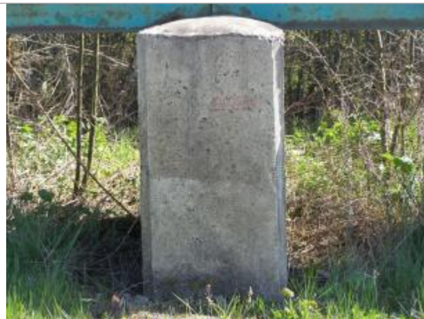
pile n° 5 de la passerelle piétonne