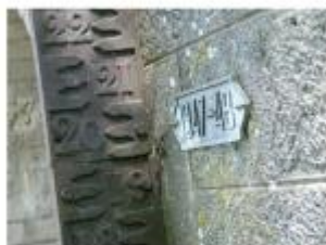
Emplacement du nivellement reporté