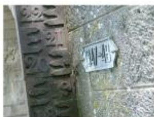
Emplacement du nivellement reporté