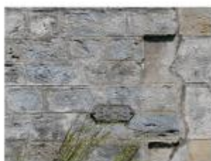
Emplacement du nivellement reporté