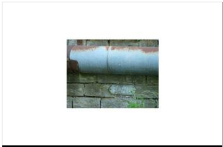
Emplacement du nivellement reporté

GÉNÉRAL Code : WEB_R_202105121823 Date de mise à jour : 23/06/2021 Auteur : DDT55