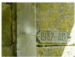
Emplacement du nivellement reporté